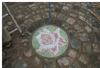
Rosen-Siegel im Kreis der Erde.

Mit 12 Staubfäden und 144 Lichtern verbindet die Säule den Stern mit dem